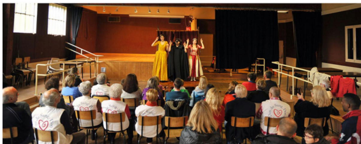
Représentation à Mathay devant les membres de l'EFS, 2015

Notre objectif commun est de sensibiliser le plus grand nombre à la réussite de la transplantation et à la nécessité des dons d'organes.